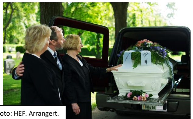
Arrangert.