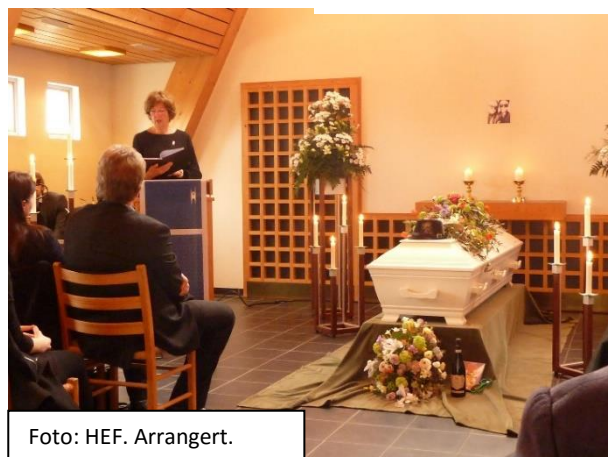
Arrangert.

Lesere av annonsetekstene leter gjerne etter hva slags type gravferdsform som er valgt av de pårørende, f.eks. humanistisk/kirkelig/buddhistisk/livssynsåpen/-privat mv. Type gravferdssymbol behøver ikke være signal om dette. Det er derfor fint om byrået veileder pårørende om at dette enkelt kan informeres om med ett ord i annonsen.